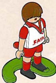
Joueur au maillot rouge sur la bande de terrain vert clair

Lance le ballon sur le terrain pour déterminer à quelle équipe revient le coup d'envoi . C'est l'équipe réceptionnant le ballon sur une bande de terrain de sa couleur qui commence.