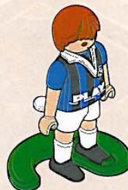
Joueur au maillot bleu sur la bande de terrain vert foncé

Choisis ton équipe : qui va jouer avec l'équipe aux maillots bleus et qui va jouer avec l'équipe aux maillots rouges ?