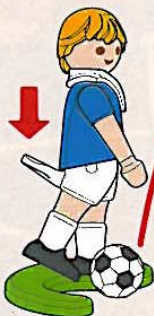
Tir en hauteur