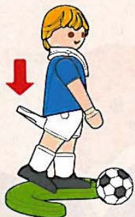
Tir au sol

Joue comme un pro ! Avec le jeu de Football de PLAYMOBIL®, tu pourras tirer comme un pro : les passes courtes, les passes longues, et même les reprises de volée n'auront plus de secrets pour toi ! Voilà comment ça marche : maintiens le buste du joueur avec l'index de ta main gauche et appuie à l'aide de l'index de ta main droite sur le levier qui se trouve derrière la jambe de tir de la figurine.